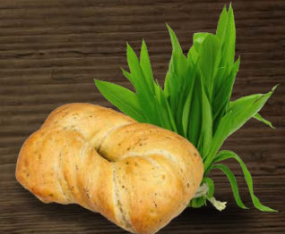
Pane mit Bärlauch*