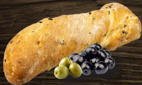
Pane mit Oliven