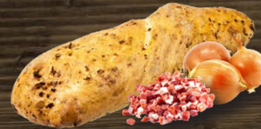
Pane mit Speck